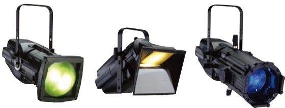
● フレネルアダプター ● CYCアダプター ● ズームレンズ